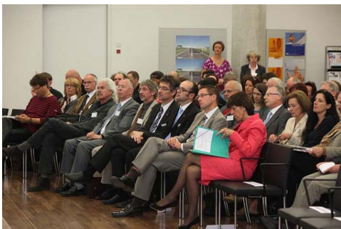
Blick ins Plenum

Die Beiträge der Landestagung werden in Kürze auf der Webseite www.suchtfragen.de eingestellt sein.